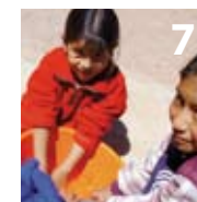
Derechos Humanos y ODM