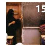
Contribución de un enfoque de los ODM basado en los derechos humanos